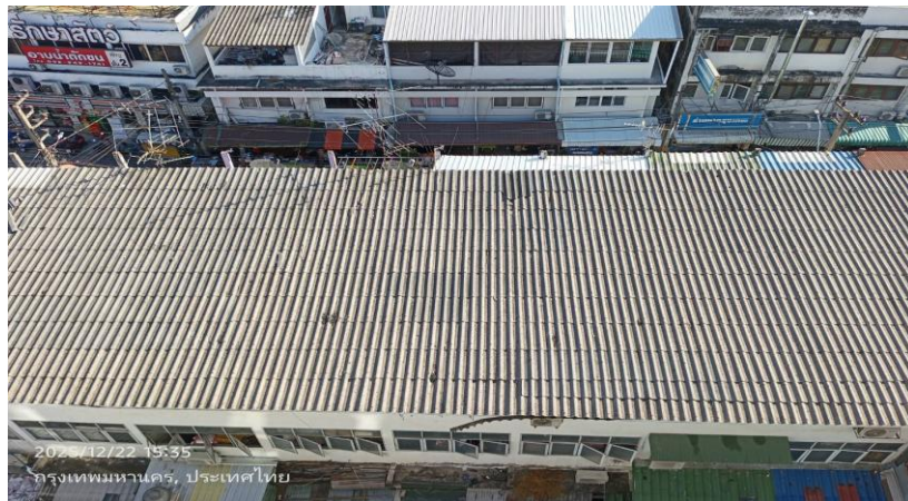
ทิศใต้ ติดกับ อาคารพาณิชย์ ขนาดความสูง 3 ชั้น