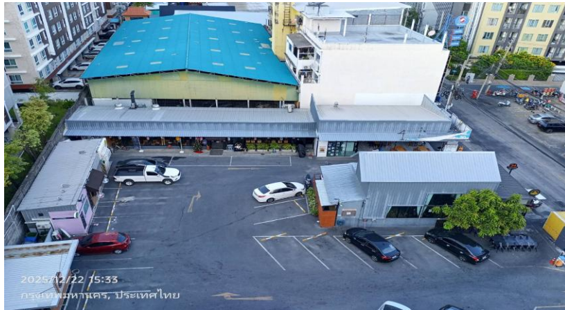
ทิศเหนือ ติดกับ โครงการ Block space พหลโยธิน 34