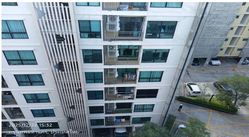
ทิศตะวันตก ติดกับ คอนโด สุภาลัย ทิวท์ รัชโยธิน-พหลโยธิน 34