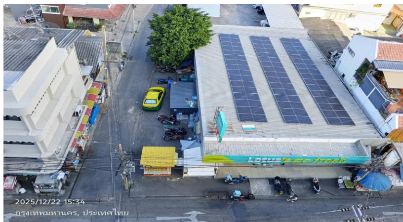
ทิศตะวันออก ติดกับ อาคารพาณิชย์ ขนาดความสูง 3 ชั้น จำนวน 4 คูหา และ LOTUS'S GO FRESH